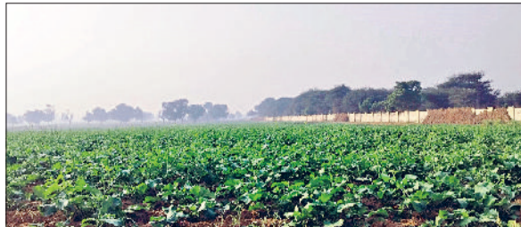
रेवाड़ी। एक खेत में तेजी से बढ़ रही सरसों की फसल।

कारण दोपहर तक मौसम गर्म महसूस होने लगा। अधिकतम तापमान 0.5 डिग्री सेल्सियस बढ़कर 29.5 डिग्री सेल्सियस पर पहुंच गया। रात का तापमान भी इतनी ही वृद्धि के साथ 9.0 डिग्री सेल्सियस दर्ज किया गया। गत वर्ष की तुलना में दोनों ही तापमान ज्यादा हैं। अभी तक गत वर्ष के मुकाबले तापमान में काफी गिरावट दर्ज की