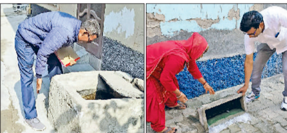
रेवाड़ी। पानी की होद में लावा की जांच करते हुए स्वास्थ्यकर्मी, लावा मिलने पर पशु खेल का पानी खाली करते स्वास्थ्यकर्मी।

प्राइवेट लैबों व 71 डेंगू के मामलों की पुष्टि सरकारी लैब से की गई है। स्वास्थ्य विभाग की टीमों अब तक घरों में लावा मिलने पर 3879 लोगों को नोटिस भी दे चुकी है। मलेरिया हेल्थ इस्पेक्टर