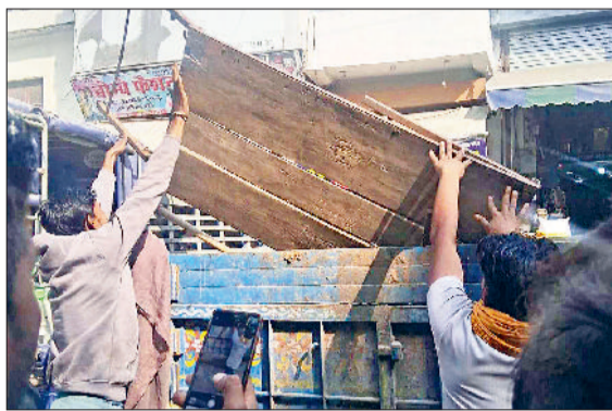
महेंद्रगढ़। सामान का ट्रॉली में डालते कर्मचारी।

नगर पालिका ने शुक्रवार दोपहर को शहर में अतिक्रमण के खिलाफ बड़ी कार्रवाई की। टीम ने विभिन्न बाजारों में छापेमारी कर दुकानों के बाहर पड़ा सामान जब्त किया और अतिक्रमण हटाया। इसके अलावा टीम ने विभिन्न दुकानदारों के पॉलिथीन रखने पर चालान काटे। नगर पालिका अधिकारियों के निर्देश पर चलाए गए अभियान का उद्देश्य सड़कों को खाली करना और यातायात जाम से निजात दिलाना है। वहीं अतिक्रमण विरोधी टीम ने मुख्य बाजारों के दुकानदारों को अपनी दुकानों के बाहर सामान न रखने की सख्त हिदायत दी। इस दौरान कई दुकानों के बाहर पड़ा सामान जब्त किया गया। यह अभियान नगर पालिका कार्यालय से शुरू होकर शंकर मार्केट, बालाजी चौक, विश्वकर्मा चौक, सीएसडी कैम्प, बस स्टैंड, राव राव तुलाराम चौक होते आईटीआई रोड अंबेडकर चौक से नगर पालिका कार्यालय में जाकर समाप्त हुआ। इसके साथ ही आगे से रोड पर