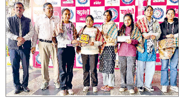
महेंद्रगढ़। विजेता बच्चों को सम्मानित करते हुए।