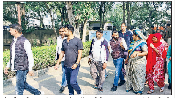
रेवाड़ी। सचिवालय में अंदर जाते ब्लॉक समिति सदस्य।